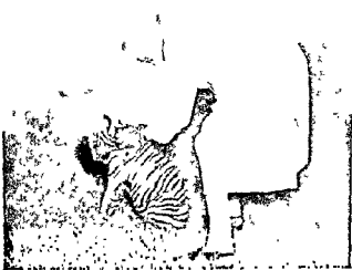
Nehru with a wild animal